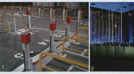
1. Julian Faulhaber, Stalle (Stalls), 2009, Digital C-Print 46 x 59inch © Julian Faulhaber, Courtesy Hasted Hunt Kraeutler

2. Julian Faulhaber, Automaten (Machines), 2007, Digital C-Print 57 x 43inch© Julian Faulhaber, Courtesy Hasted Hunt Kraeutler