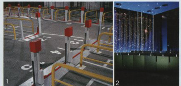
1. Julian Faulhaber, Stalle (Stalls), 2009, Digital C-Print 46 x 59inch